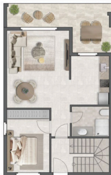
First Floor Plan