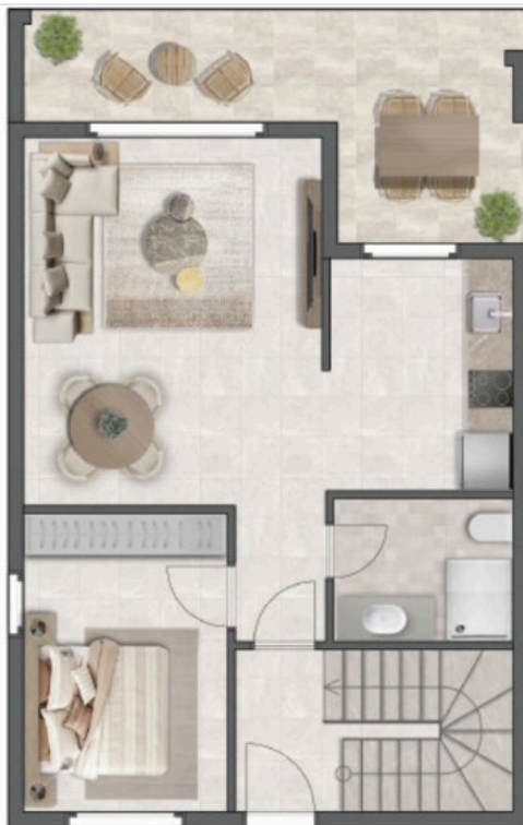
Ground Floor Plan