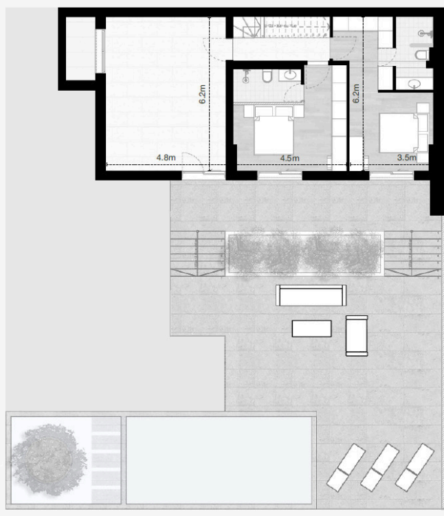
PLAN GROUND FLOOR